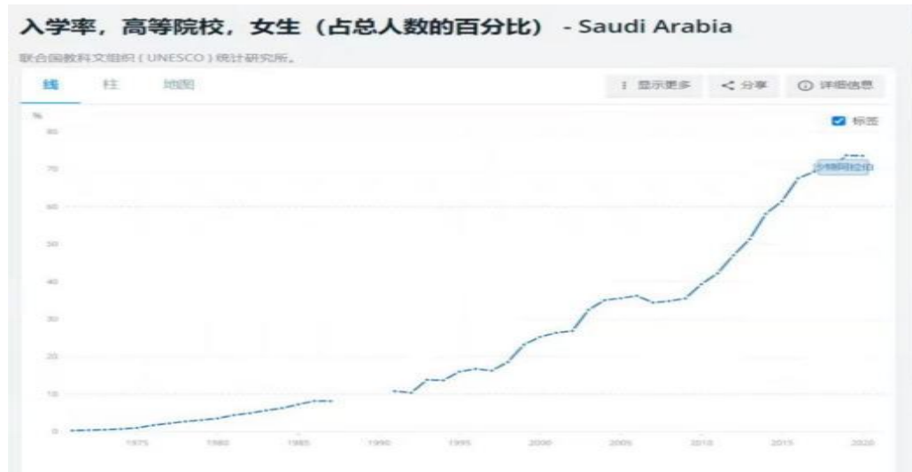
الشكل (1): بيانات مبيان نحو التحاق المرأة السعودية بالجامعات

البنك الدولي للتعمير والتنمية) ( https://data.worldbank.org.cn/ )